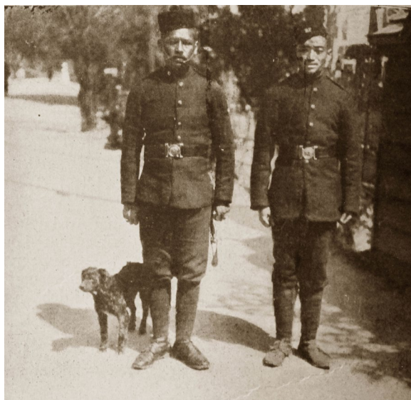
6. kép: Séták a nagyvilágban. Rendőrök Darjilingben [!]. A bal oldali rendőr a mangar népfajhoz tartozik. Vojnich Oszkár fényképe (forrás: Uj Idők , 1912. július 28. 118.)

Utazásai során mindig érdeklődéssel fordult az ott lakó emberek felé. Érdekelte a megjelenésük, a külsejük (nemegyszer beleértve az antropológiai jellegzetességeket is), az öltözetük, a viselkedésük, a szokásaik, hagyományaik, mindennapi életük. Mivel számos olyan országban járt, amely valamelyik gyarmatbirodalomhoz tartozott, olykor a gyarmatosok életmódjáról is írt, és nemegyszer érdekes találkozásokat is megörökített írásban és/vagy képen. Rögtön az első, Uj Idők ben megjelent írása is ide tartozik, hiszen Nansen második északi-sarki expedíciója előtt a felfedező Fram nevű hajójára látogathatott el, de említhető néhány fényképe 1910-ból is, amelyet az Afrikában vadászó Theodore Roosevelt és fia úti társaságáról készített.