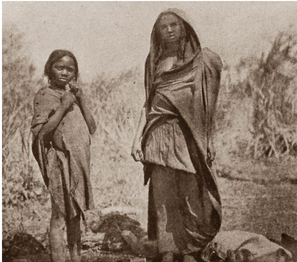
5. kép: Szudáni asszony és leánya. Vojnich Oszkár amatőr-fényképe (Forrás: Uj Idők , 1909. június 20. 615.)

A szerzőt – és ez nemcsak könyveiből, hanem az Uj Idők ben megjelent cikkeiből is látható – minden érdekli, legyen szó természeti tájról vagy épített környezetről, helyi lakosokról vagy utazókról, a mindennapi életről vagy ünnepi alkalmakról, öltözetről, étkezésről vagy különböző szokásokról. A lap közönsége olvashatott tőle norvég tőkehaltelepről, pompeji utcáról, nilusi turistahajóról, holland gyarmati katonákról, szumátrai rizsteraszokról és a szingapúri növényteni kert kaucsukfáiról is.