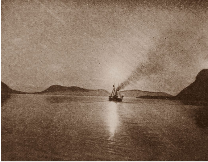
9. kép: A bálnavadász hajója.