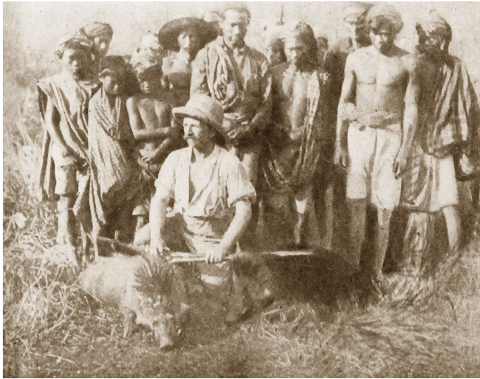
12. kép: Két vadkan egy hajtásban. A háttérben makasszeriek [!] és bugik. Vojnich Oszkár fényképe (forrás: Uj Idők , 1913. június 29. 13.)

A különböző, olykor a könyvismertetésekben is szereplő jellemzések mintegy összefoglalásának is tekinthető Herczeg Ferenc Uj Időkben megjelent búcsúztatásának zárása, amelyben úgy fogalmazott, hogy Vojnich Oszkár halálával „a föld egy előkelő, tiszta, nemes, erős és jó emberrel, egy igazi férfival lett szegényebb”. 52