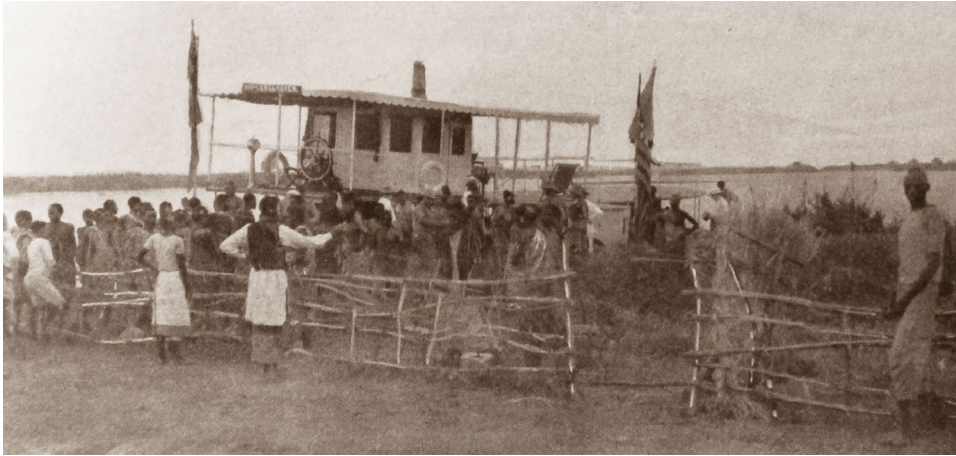
7. kép: Roosevelték Afrikában. Vojnich Oszkár magyar sportsman Gondokoroban találkozott Roosevelt vadásztársaságával, s ezeket a fényképeket készítette róluk [első kép]

Saját reflexiói, néhány felidézett párbeszéd pedig személyessé. Olykor megcsillan a humora is.