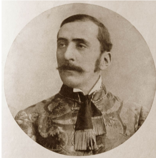
3. kép: Herczeg Ferenc országgyűlési képviselő korában (forrás: Uj Idők, 1933. szeptember 24. 407.)