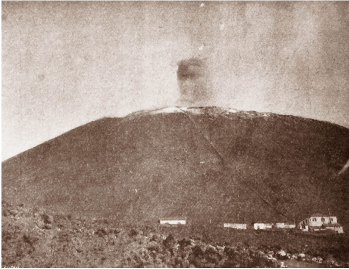
11. kép: „A füstölgő Vesuvio”. Vojnich Oszkár amatőr-fényképe (forrás: Uj Idők , 1906. április 8. 344.)