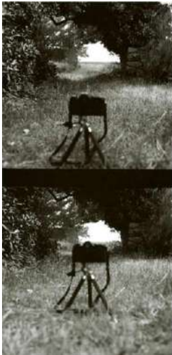
Denis Roche, Belle-Île, le 1 er juin 1979

La série telle qu'elle se trouve dans La disparition des lucioles constitue une mise en abîme spatio-temporelle. Les photos sont prises avec un appareil 24x36 dont l'image a une forme rectangulaire et un appareil 6x6 dont l'image a une forme carrée. Sur la première photo, prise au 6x6, nous voyons un paysage, un passage dans un hallier, les contours d'un bâtiment ou mur en pierre, et l'appareil 24x36 sur un trépied. Le format rectangulaire de la seconde photo suggère qu'elle a été prise par l'appareil qui figurait sur la première photo et elle montre le 6x6 sur un trépied à l'emplacement où la première photo a été prise, ce que suggère le décalage progressif vers l'arrière. Le jeu de la prise de vue de l'appareil avec lequel la photo précédente a été prise se répète encore deux fois, mais il pourrait se répéter jusqu'à l'infini. L'important est l'abîme qui s'ouvre dans l'entrelacement des photos, abîme d'espace et de temps. Abîme qui peut être reconstitué par l'imagination du lecteur/spectateur grâce à la forme de l'image.