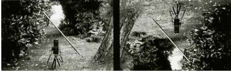
Denis Roche, 24 août 1997, Belle-Île, Le Skeul, Hommage à Wittgenstein .

face qui se prête à des jeux de forme (voir entre autres : le parallélogramme formé par les deux arbres ou celui dessiné au sens inverse par l’outil de jardinage).