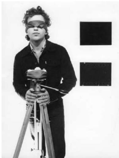
György Stalter, Double portrait , 1977

le milieu des photographes dans les années 1970-80. On le retrouve également chez quelques artistes hongrois, tel István Szirányi qui explore dans une série de clichés la fusion de l’homme et la caméra, ainsi que chez György Stalter, chez qui une interdépendance se dévoile entre le photographe et son appareil dans son œuvre Double portrait (1977) (ci-contre). L’appareil devient même autonome de son utilisateur dans l’œuvre intitulée Jeu 1 (1976), c’est la machine qui capte le jeu du photographe qui joue à se photographier. On retrouve le thème chez Ben Vautier ( Une photo qui se regarde 2 , 1997) ou encore chez Michael Snow ( Authorization 3 , 1969). Chez Snow, la photo exhibe la manière dont elle a été fabriquée. Le photographe se place avec sa caméra devant une glace et prend une première photo, qu’il développe et colle sur la