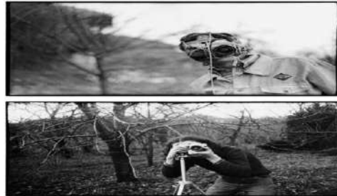
István Szirányi, L’homme-appareil-photo , 1976

Ce que le philosophe décrit dans son ouvrage Pour une philosophie de la photographie , plusieurs artistes le mettent en images. On le retrouve en premier dans le film de Dziga Vertov, L’homme à la caméra , (1929), mais ce topos se répand dans